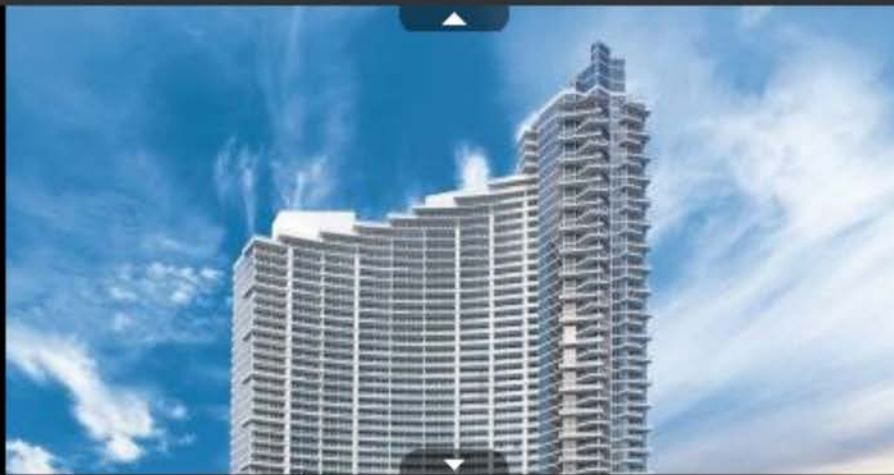
Foto 9 de 23 - Os preços atraentes têm levado muitos brasileiros a comprar imóveis na Flórida, nos Estados Unidos. Na imagem, fachada do Paramount Bay, em Miami. Todas as áreas comuns foram projetadas pela Kravitz Design, empresa do cantor Lenny Kravitz. Segundo a Fortune International, as vendas começaram no dia 15 de outubro. Os preços partem de US$ 470 mil