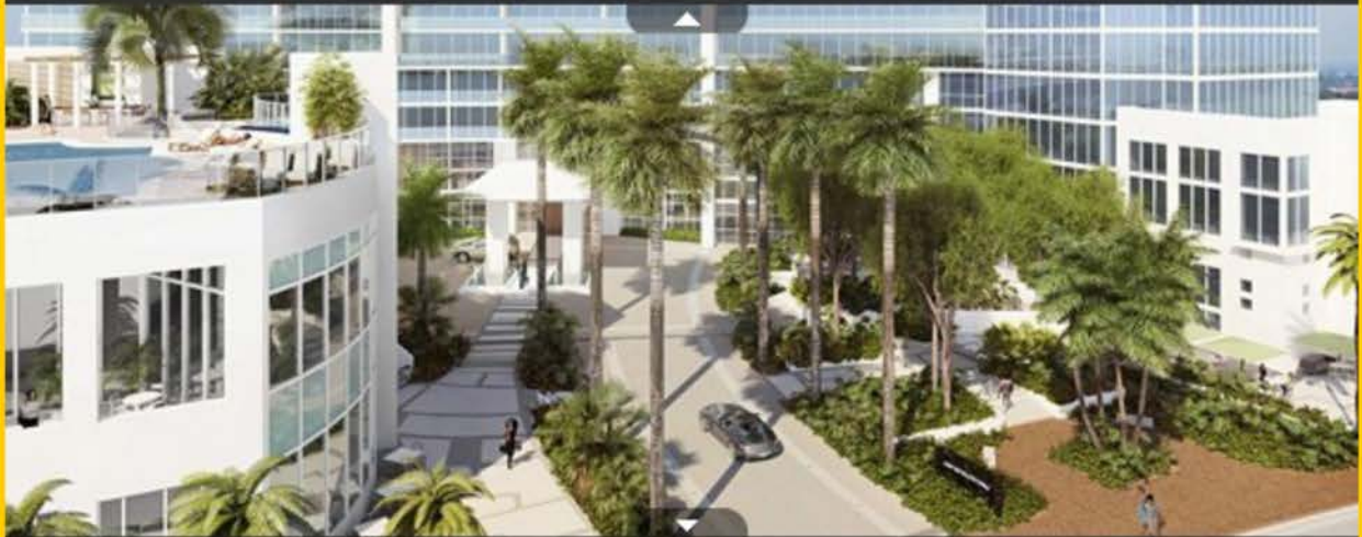
Foto 11 de 28 - Os preços atraentes têm levado muitos brasileiros a comprar imóveis na Flórida, nos Estados Unidos. Na imagem, praça do Paramount Bay, em Miami. Todas as áreas comuns foram projetadas pela Kravitz Design, empresa do cantor Lenny Kravitz. Segundo a Fortune International, as vendas começaram no dia 15 de outubro. Os preços partem de US$ 470 mil