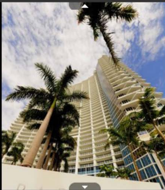
Foto 8 de 23 - Os preços atraentes têm levado muitos brasileiros a comprar imóveis na Flórida, nos Estados Unidos. Na foto, fachada do Paramount Bay, em Miami. Todas as áreas comuns foram projetadas pela Kravitz Design, empresa do cantor Lenny Kravitz. Segundo a Fortune International, as vendas começaram no dia 15 de outubro. Os preços partem de US$ 470 mil